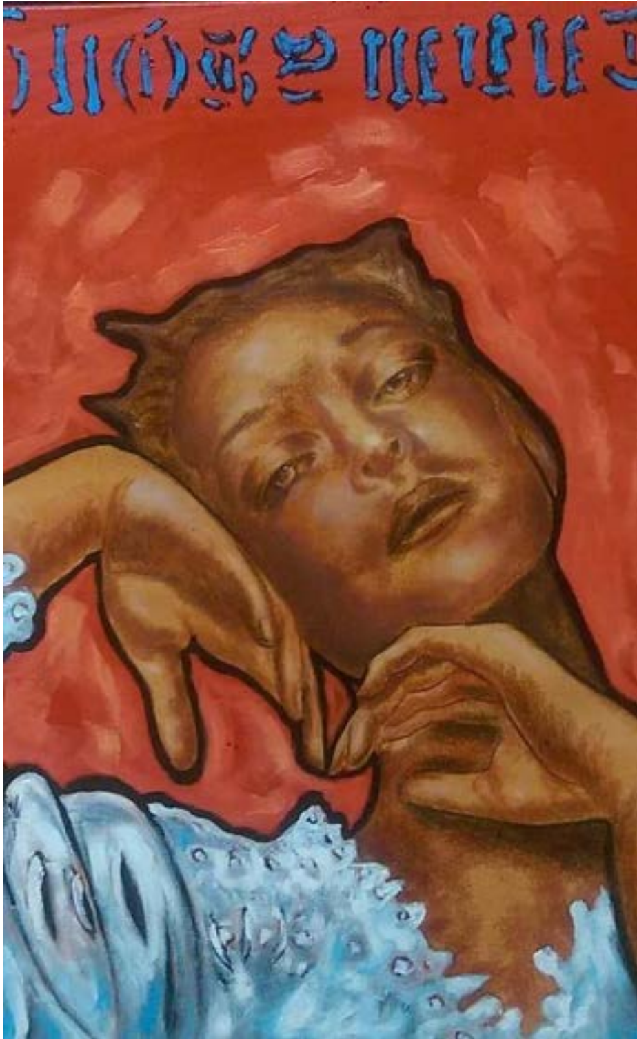
TÍTULO: MARIA MAGDALENA AÑO: 2018 TÉCNICA: ÓLEO SOBRE TELA MEDIDAS: 100 x 80 CM