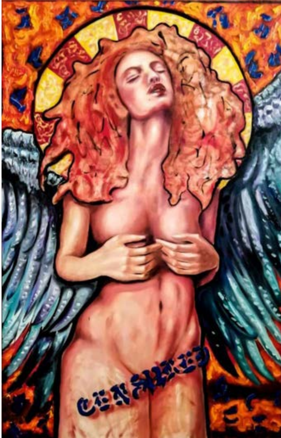
TÍTULO: UN ÁNGEL AÑO: 2021 TÉCNICA: ÓLEO SOBRE TELA MEDIDAS: 121 X 80 CM