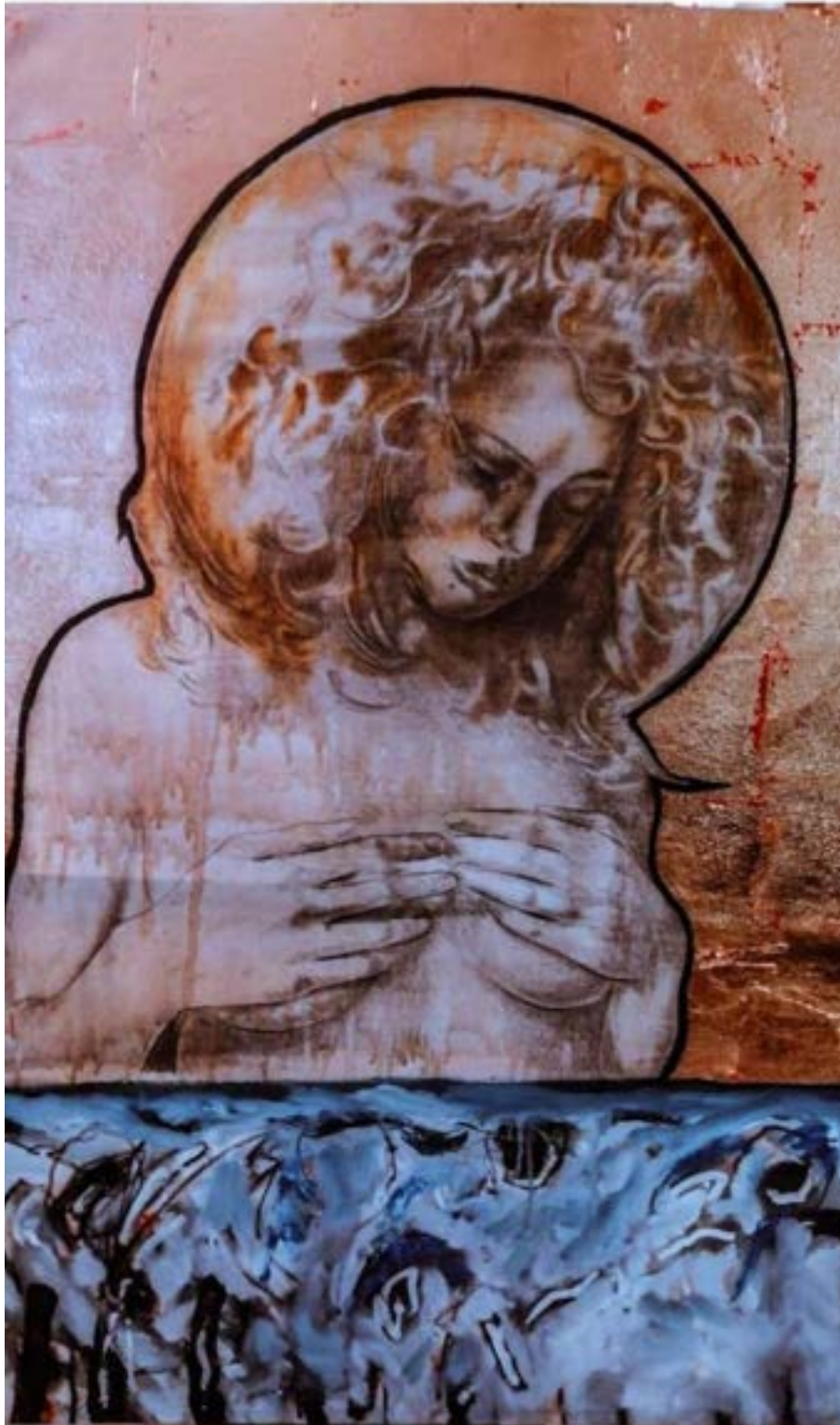
TÍTULO: SANTA MARÍA MAGDALENA, LUCHANDO CONTRA LOS DEMONIOS. AÑO: 2020. TÉCNICA: ÓLEO SOBRE LIENZO. MEDIDAS: 120 X 82 CM