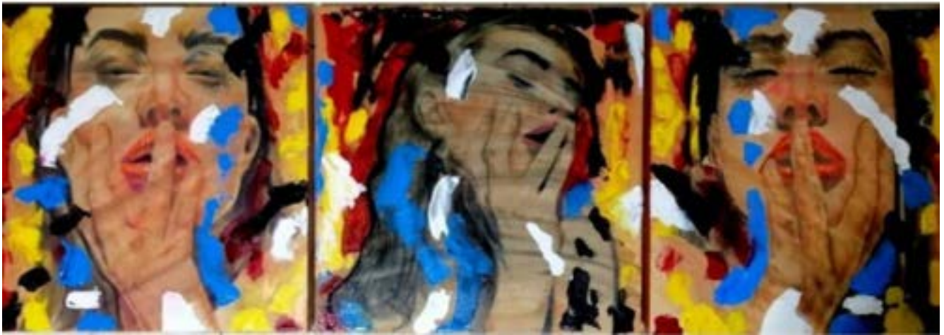
TÍTULO: SANTA MARIA MAGDALENA AÑO: 2018 TÉCNICA: ÓLEO SOBRE TELA MEDIDAS: 160 X 130