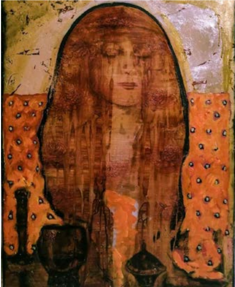
TÍTULO: LAMIA AÑO: 2021 TÉCNICA: ÓLEO SOBRE LIENZO Y HOJILLA DE ORO. MEDIDAS: 80X 60 CM.