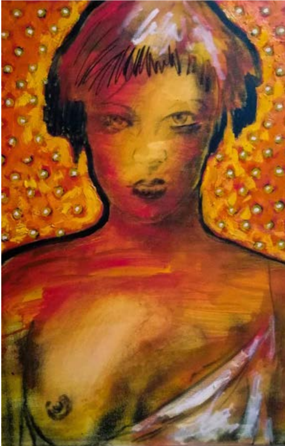
TÍTULO: NIÑA ILUMINADA II AÑO: 2021 TÉCNICA: ÓLEO SOBRE TELA MEDIDAS: 70X50 CM