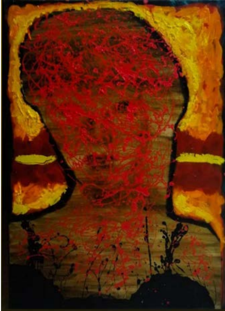
TITULO: RESPLANDOR AÑO: 2021 TÉCNICA: ÓLEO SOBRE TELA MEDIDAS: 90 X 60 CM