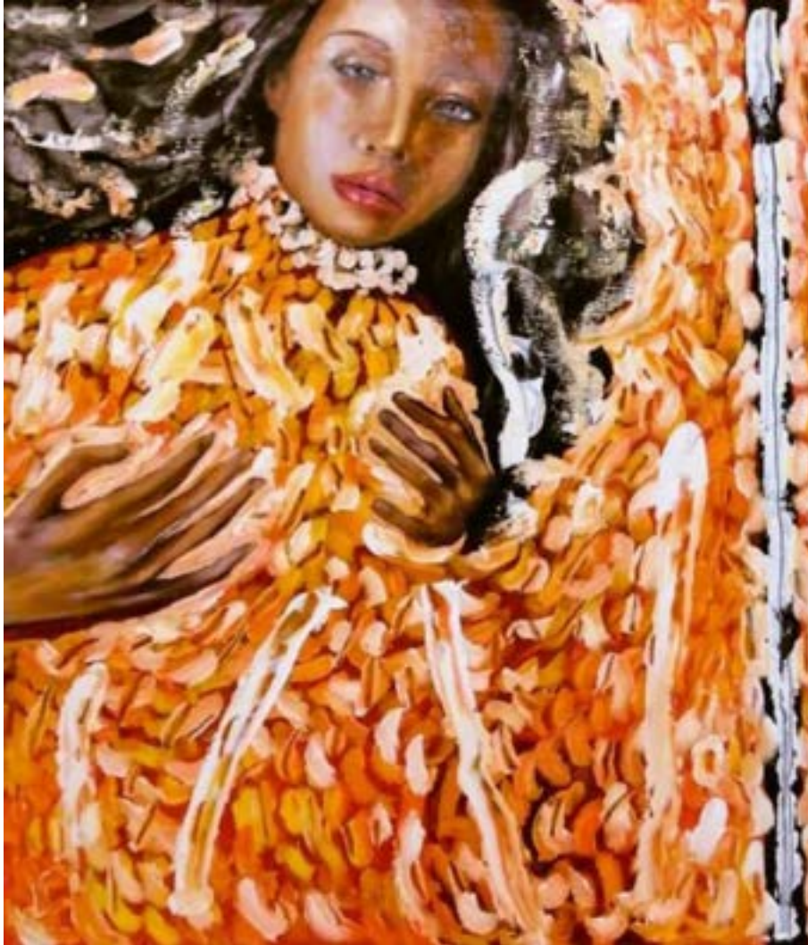
TÍTULO: CORAZÓN DE MARÍA MAGDALENA. AÑO: 2020. TÉCNICA: ÓLEO SOBRE LIENZO. MEDIDAS: 121 X 82 CM.