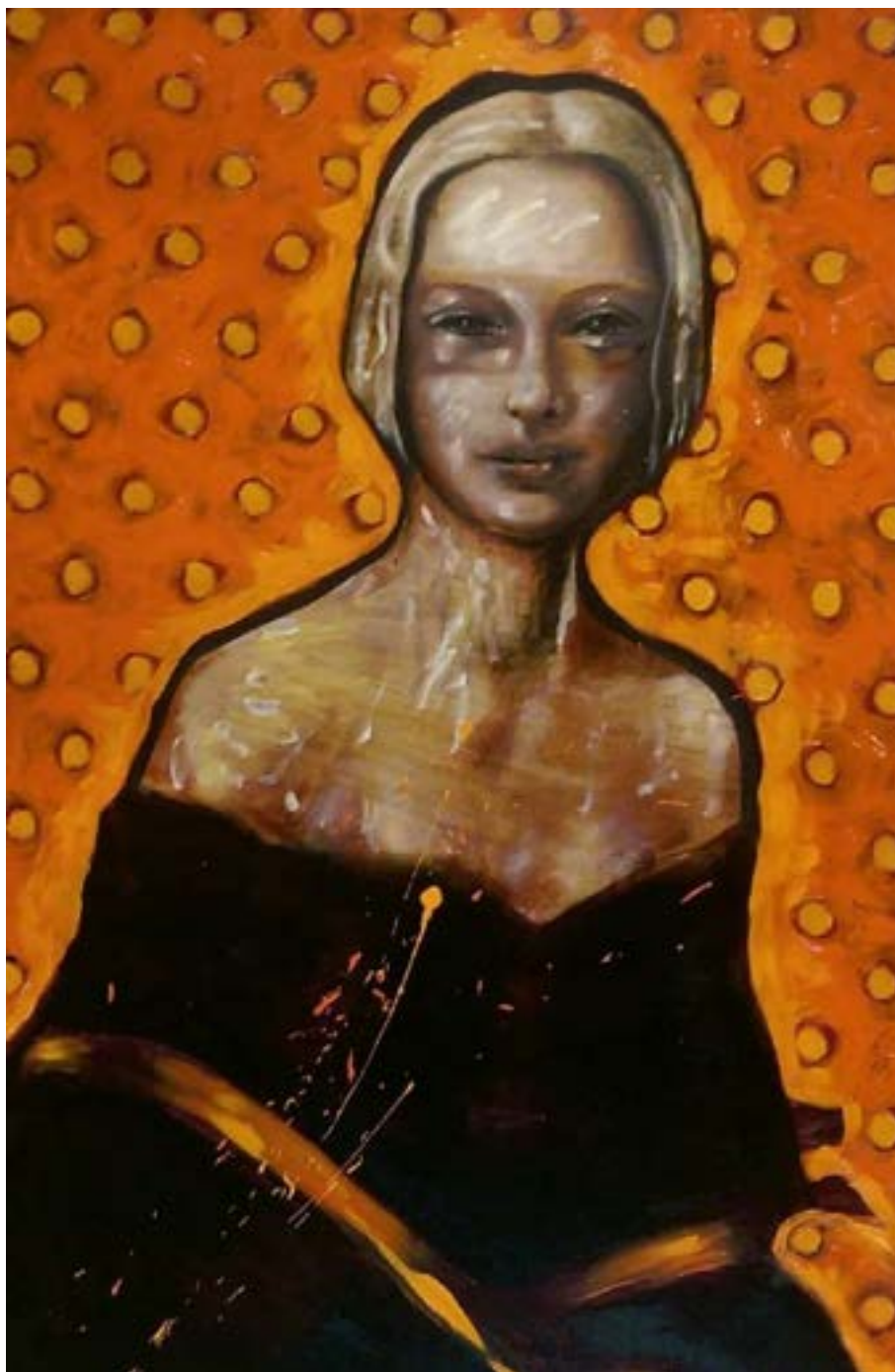
TITULO: NOCTURNO CÁLIDO AÑO: 2021 TÉCNICA: ÓLEO SOBRE LIENZO MEDIDAS: 90 X 60 CM