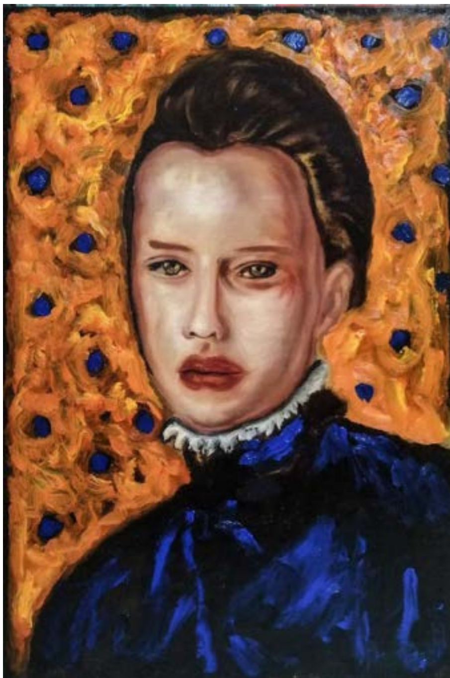
TITULO: NATASHA NOCTURNA. AÑO: 2021 TÉCNICA: ÓLEO SOBRE LIENZO. MEDIDAS: 90 X 60 CM