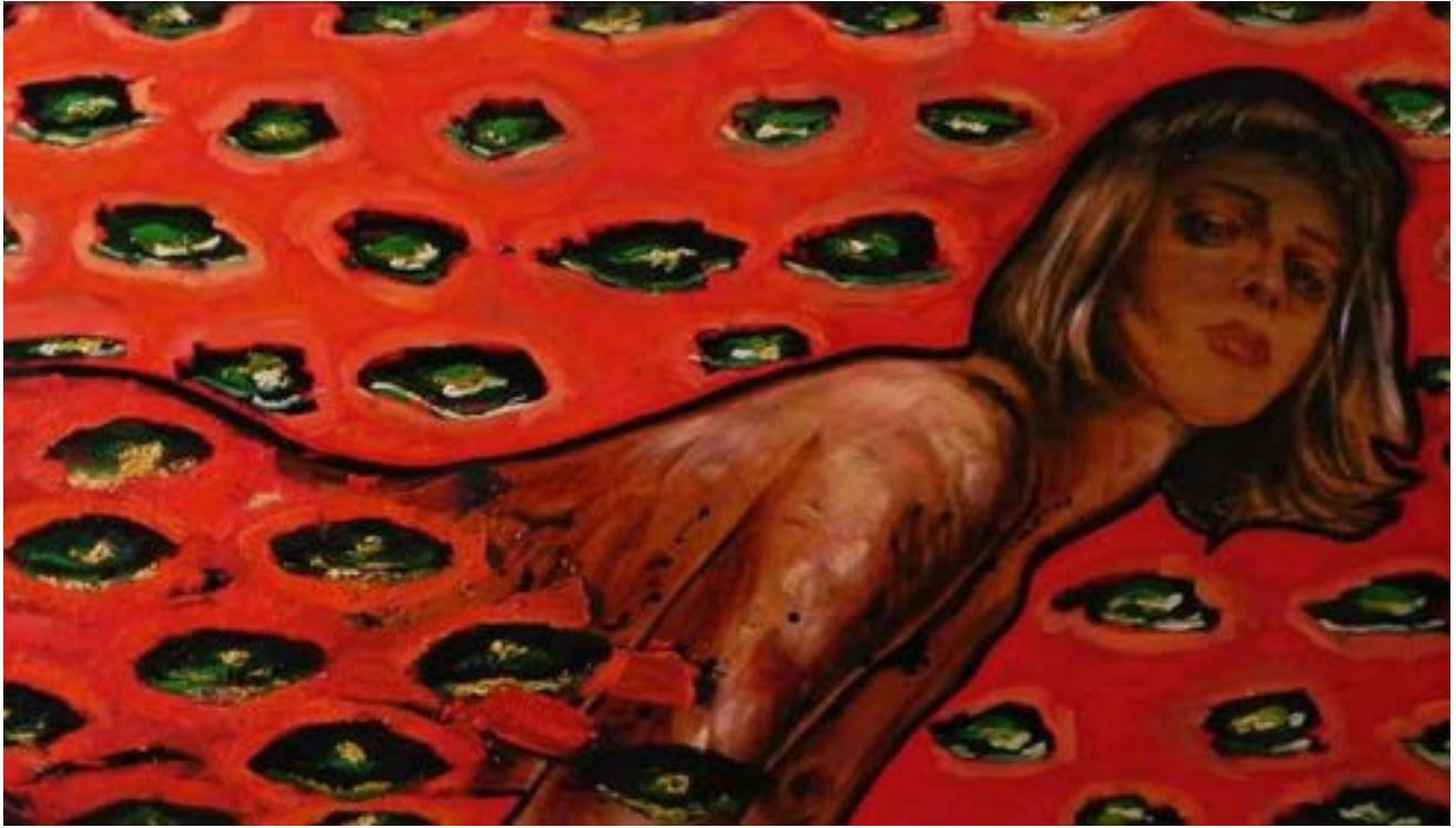
TÍTULO: OFELIA EN EL ESTANQUE AÑO: 2017 TÉCNICA: ÓLEO SOBRE TELA MEDIDAS: 80 X 160 CM