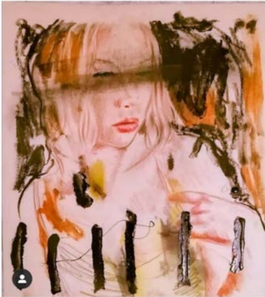
TÍTULO: ESTUDIO EN CUARENTENA, PARA MAGDALENA. AÑO: 2020 TÉCNICAS: TÉCNICA MIXTA, SOBRE CARTULINA FABRIANO, MEDIDAS: 50 X 50 CM