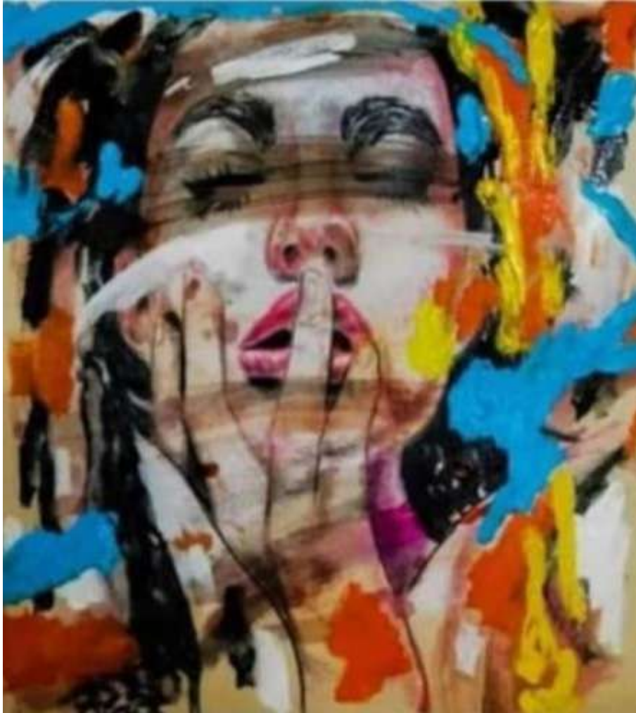
TÍTULO: ESTUDIO PARA MARÍA MAGDALENA AÑO: 2020 TÉCNICA: ÓLEO SOBRE CARTULINA FABRIANO. MEDIDAS: 50 X 50 CM.