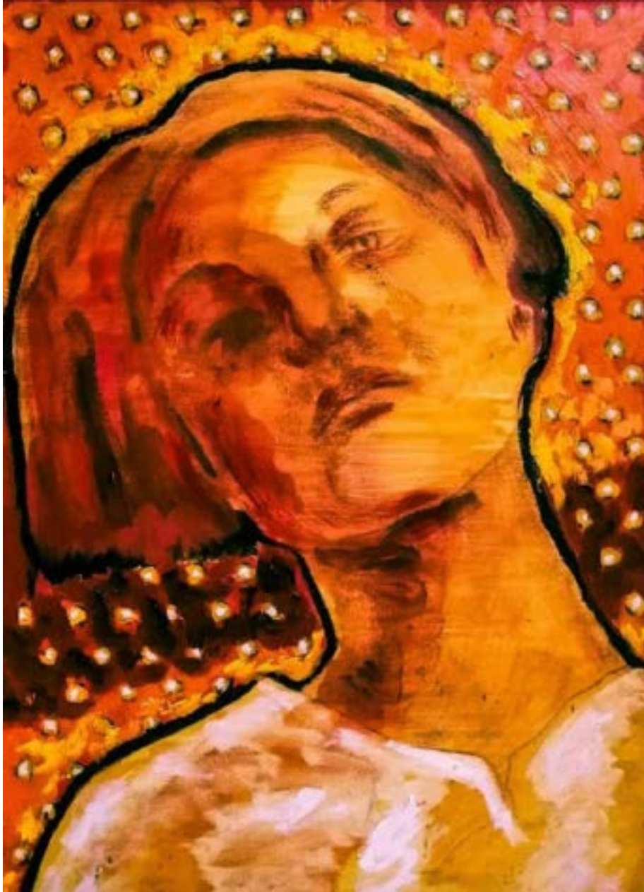
TÍTULO: ILUMINADA I AÑO:2021 TÉCNICA: ÓLEO SOBRE TELA MEDIDAS: 70 X 50 CM