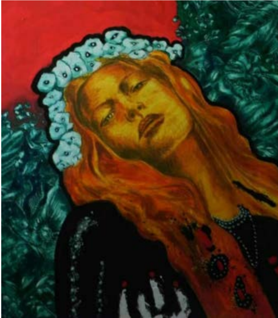
TITULO: NINFA I AÑO: 2017 TÉCNICA: ÓLEO SOBRE TELA MEDIDAS: 80 X 160 CM