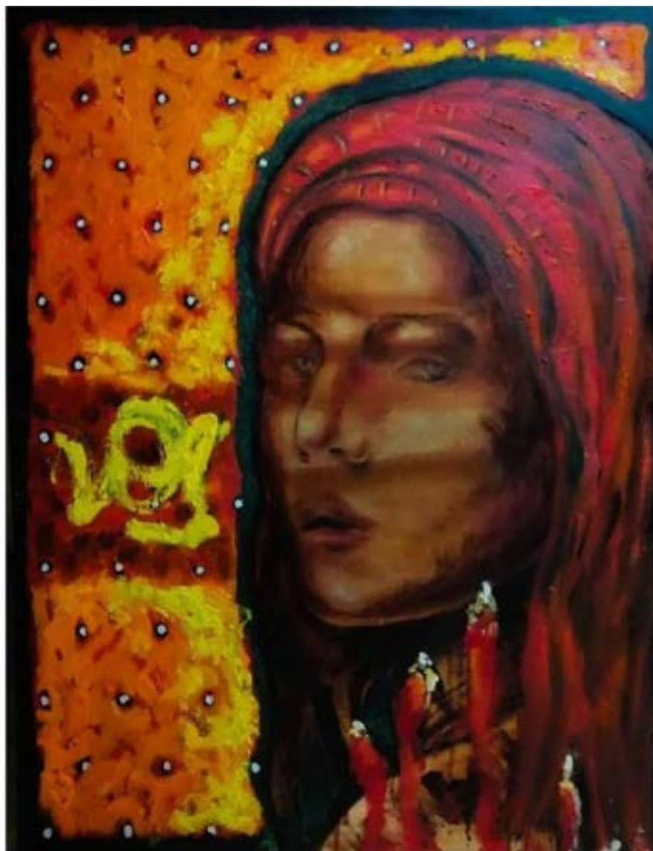
TÍTULO: NIÑA II AÑO: 2018 TÉCNICA: ÓLEO SOBRE TELA MEDIDAS: 120 X 80 CM