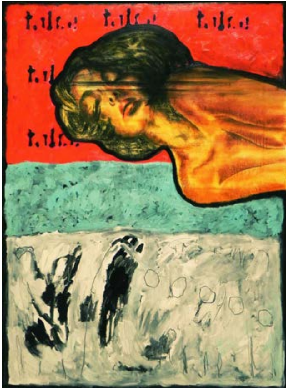
TÍTULO: SANTA MARÍA MAGDALENA LUCHANDO CONTRA LOS DEMONIOS. TÉCNICA: ÓLEO SOBRE LIENZO. AÑO: 2020. MEDIDAS: 120 X 82 CM