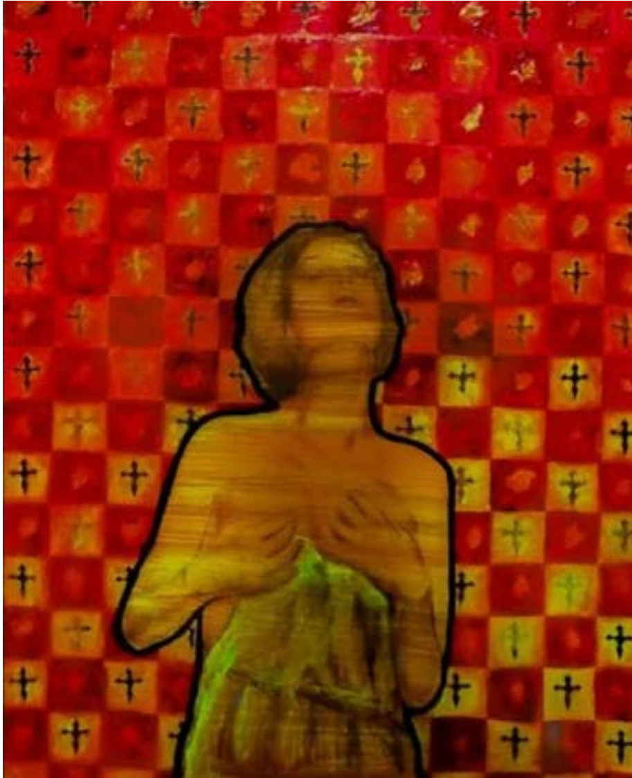
TÍTULO: MAGDALENA EN ROJO. AÑO: 2020 TÉCNICA: ÓLEO SOBRE LIENZO. MEDIDAS: 121 X 82 CM