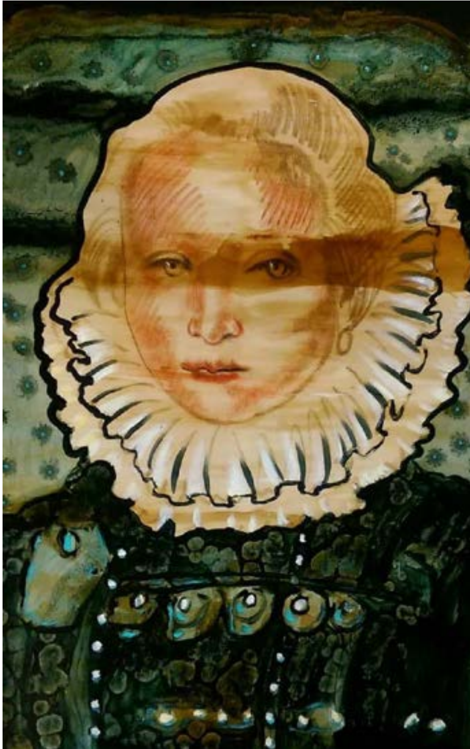
TÍTULO: DAMA NOCTURNA AÑO: 2017 TÉCNICA: ÓLEO SOBRE TELA MEDIDAS: 100 X 70 CM