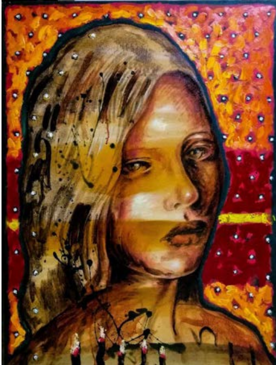
TITULO: NOCTURNO III AÑO: 2021 TÉCNICA: ÓLEO SOBRE TELA MEDIDAS: 80 X 50 CM